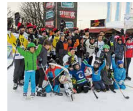
Eishockey ist angesagt.