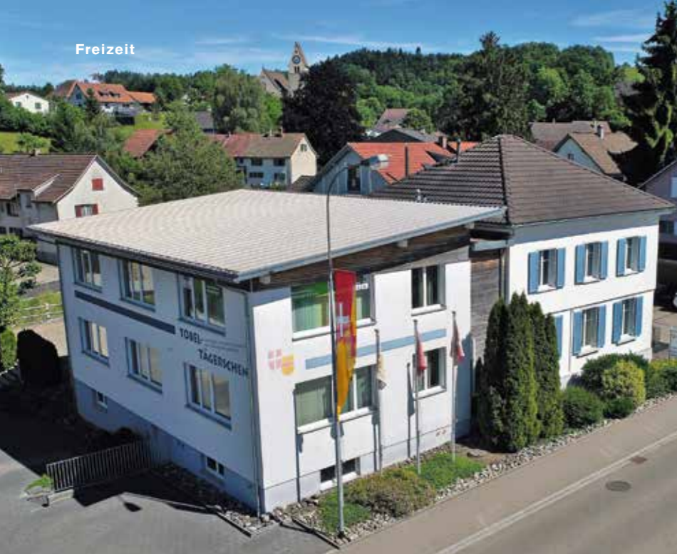
Steht im Zentrum: das Gemeindehaus von Tobel-Tägerschen.