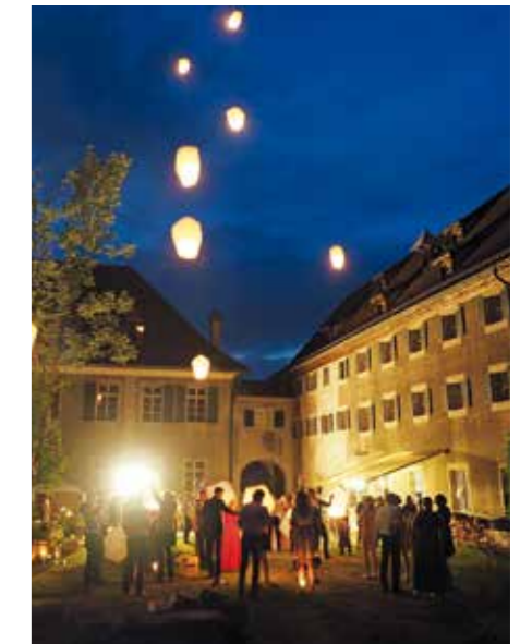
Geselligkeit: Heute lässt sich die Komturei Tobel für private Festivitäten mieten.

vermag (siehe Box). Andernfalls lenken wir die Schritte Richtung Hof, queren die Strasse und nähern uns der Burg Heitnau. Achtung: Man könnte sie glatt übersehen, denn vom einstigen wehrhaften Bau sind nur noch Reste der Grundmauern erhalten. Entstanden war die Burg um 1200 als Dienstherrensitz für die Grafen von Toggenburg, doch