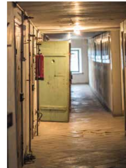
Elend: Der Zellentrakt in der einstigen «Arbeits- und Zuchtanstalt Tobel».