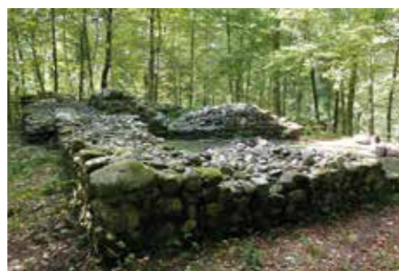
Die Reste der Burg Heitnau.