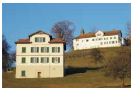
Unteres und oberes Schloss Bettwiesen.

Und der Bau auf halber Höhe des Hügel? Das «Untere Schloss» diente zuletzt als Personalunterkunft der Verzinkei Bettwiesen – heute steht es leer.