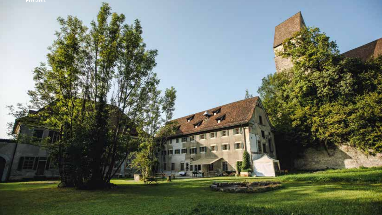
Am Fuss der Kirche St. Johannes liegt das weitläufige Gelände der Komturei Tobel.