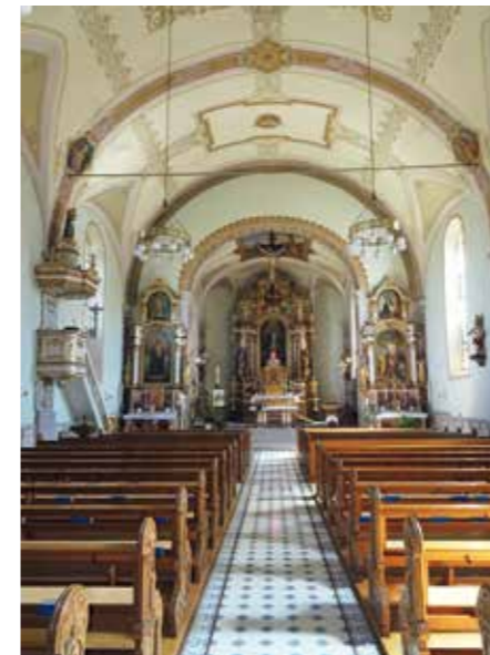
Glanz: Die Kirche Tobel mit prächtigem Altar und barockem Zierat.

An der Nordflanke des Braunauer Bergs wenden wir uns nun wieder Richtung Westen. Wer bereits eine gepflegte Rast einlegen möchte, sticht hinunter Richtung Riethüsli, wo eine gemütliche Schenke Hunger und Durst zu stillen